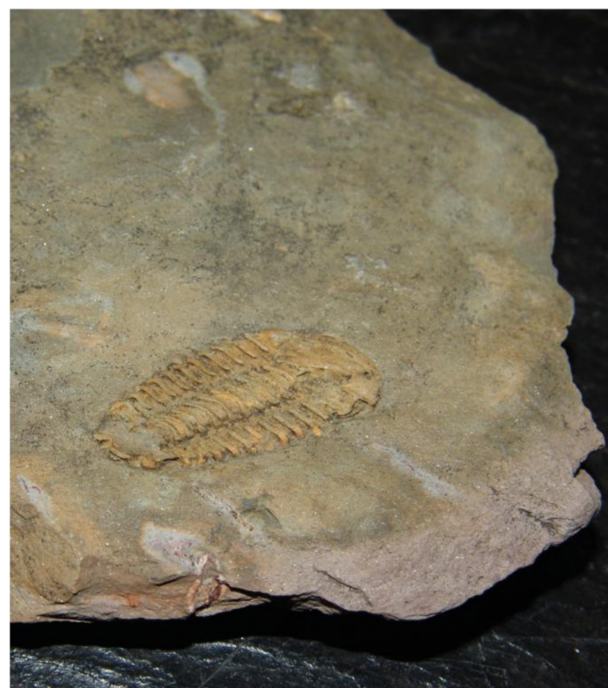
Foto: Fóssil de Trilobite Photo: Trilobite fossil Município de Valongo