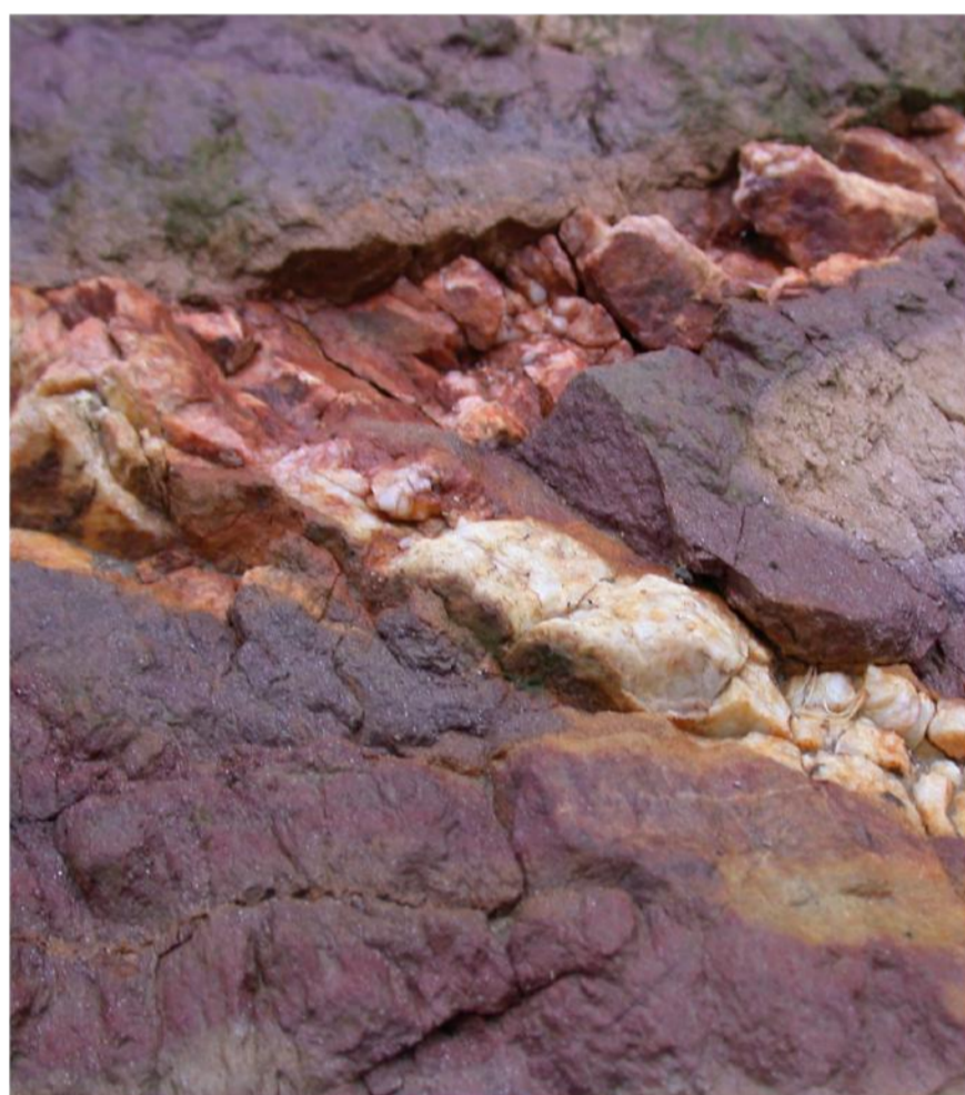
Foto: Quartzito com Filão de Quartzo Photo: Quartz vein Sara Leal