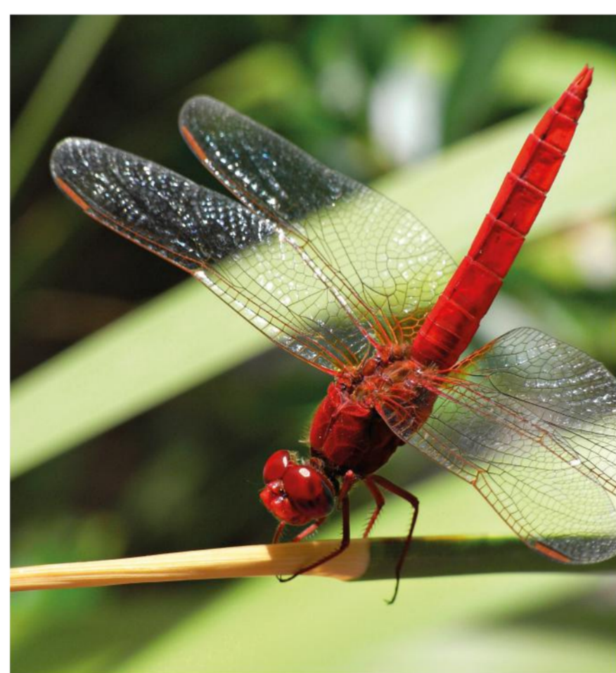
Foto: Libélula-escarlata Photo: Scarlet dragonfly | Public domain