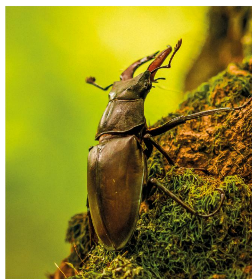
Foto: Vaca-loura Photo: The European stag beetle