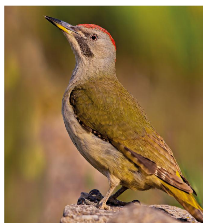
Foto: Peto-verde Photo: Iberian green woodpecker | Paulo Ferreira