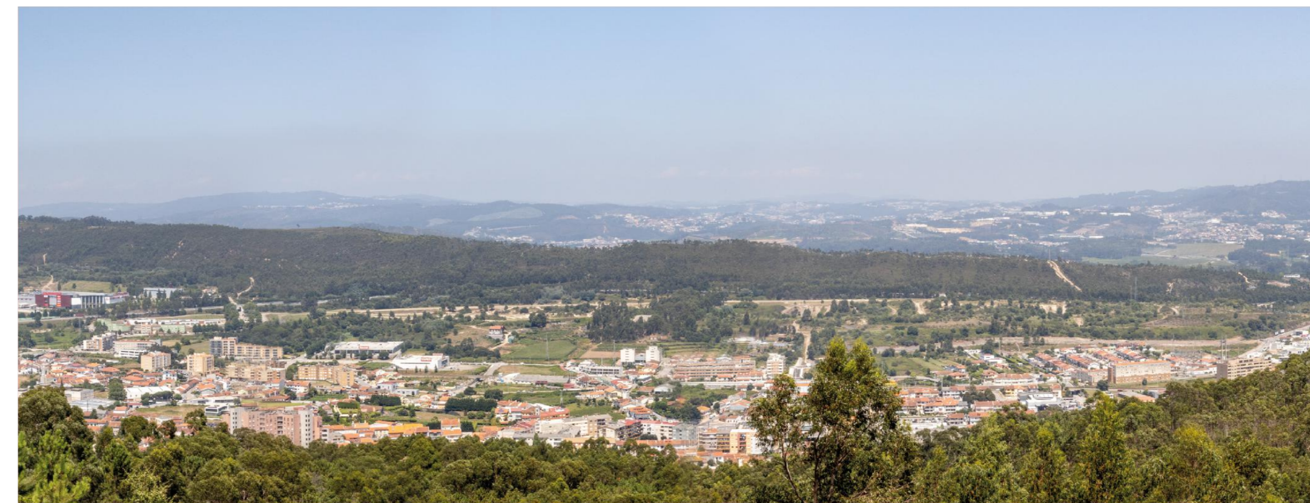
Foto: Miradouro do Paleozóico - Vista Panorâmica | Photo: Paleozóico Viewpoint - Panoramic View

Enjoy this infrastructure in safety, without neglecting the recommendations and rules of conduct. Have a good hike!